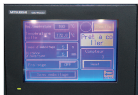
Écran tactile simple d'utilisation