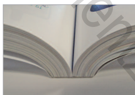
Un dos carré collé impeccable