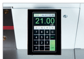
Commande électronique programmable avec écran tactile