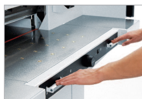
Commande bi-manuelle EASY-CUT